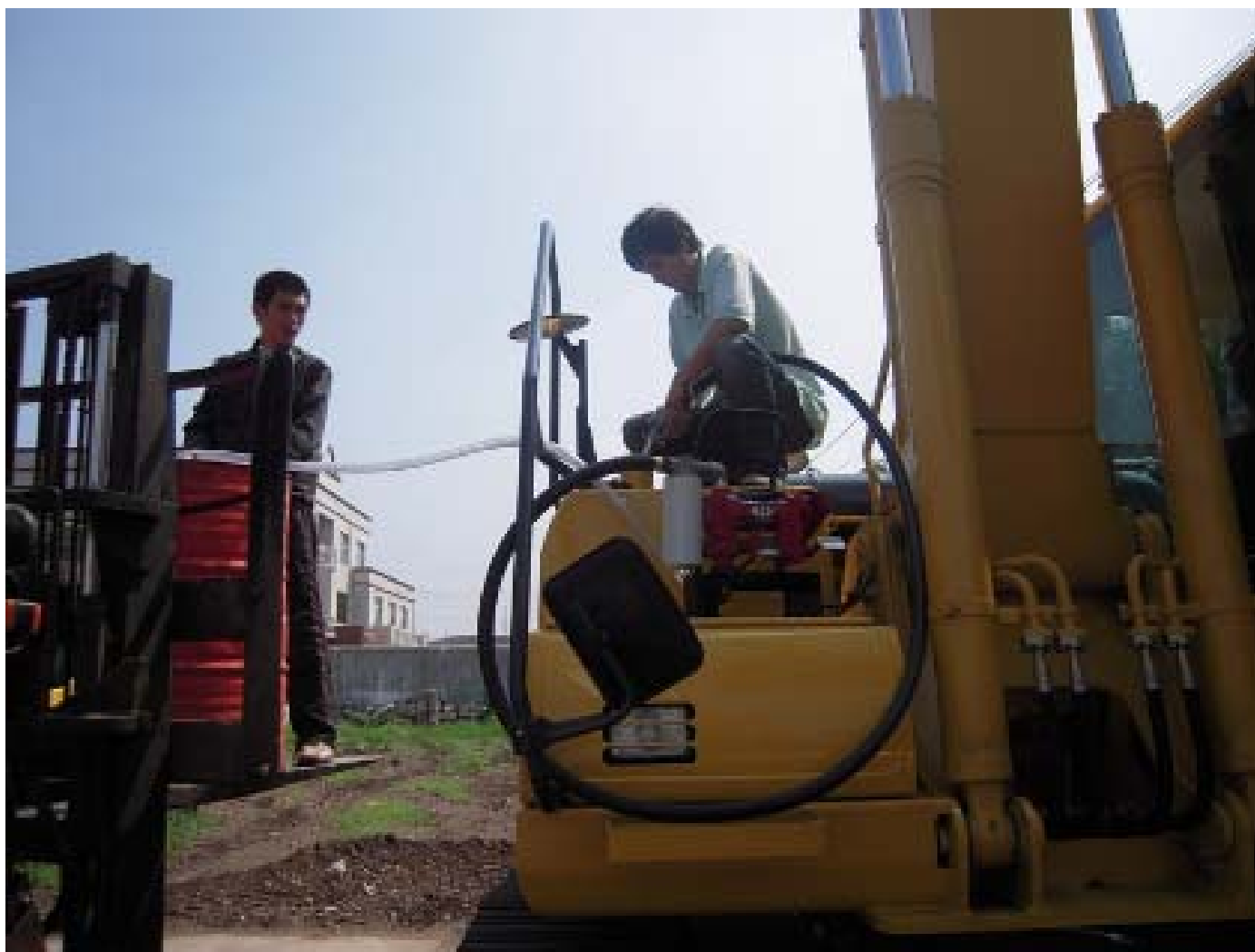
小松机械 使用案例